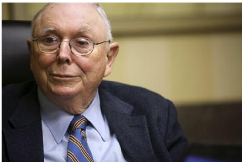
ชาร์ลีส มังเกอร์ (Charles T. Munger)

“ตลอดชีวิตที่ผ่านมา ผมไม่เคยรู้จักผู้รอบรู้ในสาขาใด ที่ไม่ได้อ่านตลอดเวลา ไม่มีเลยแม้สักคนเดียว”